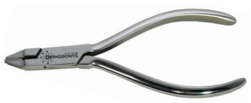
Alicate perfurador de fenda para alinhador