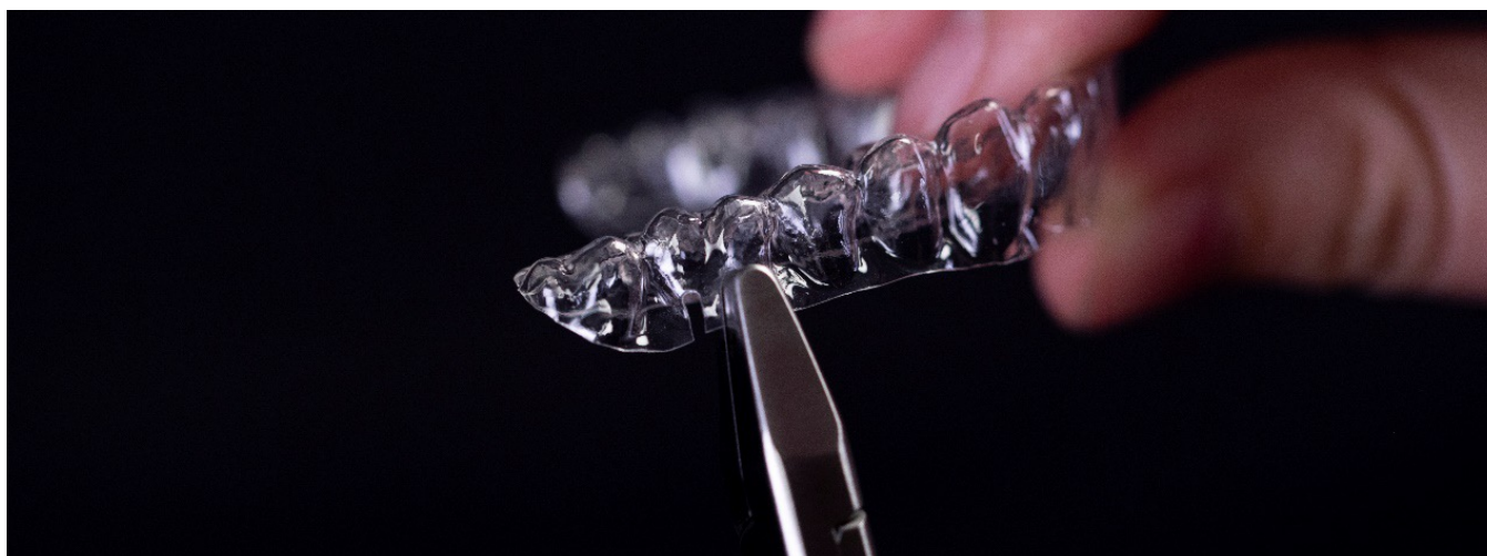
Recorte de fenda dupla acima do primeiro molar da arcada superior

1. Modifique o(s) alinhador(es) superior(es) para se preparar para a utilização de elásticos com recortes de fendas no alinhador: Use um alicate de fenda para alinhador para criar um recorte de fenda dupla na margem gengival acima dos molares superiores e onde o elástico será fixado.