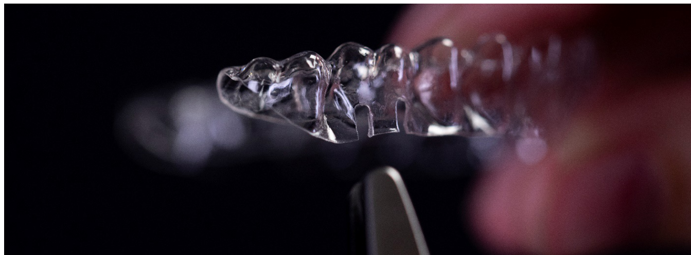
Recorte de fenda dupla abaixo do primeiro molar da arcada inferior

2. Modifique o alinhador inferior para se preparar para a utilização de elásticos com recortes de fendas no alinhador: Use um alicate perfurador de fenda para alinhador para criar um recorte de fenda dupla na margem gengival abaixo dos molares.