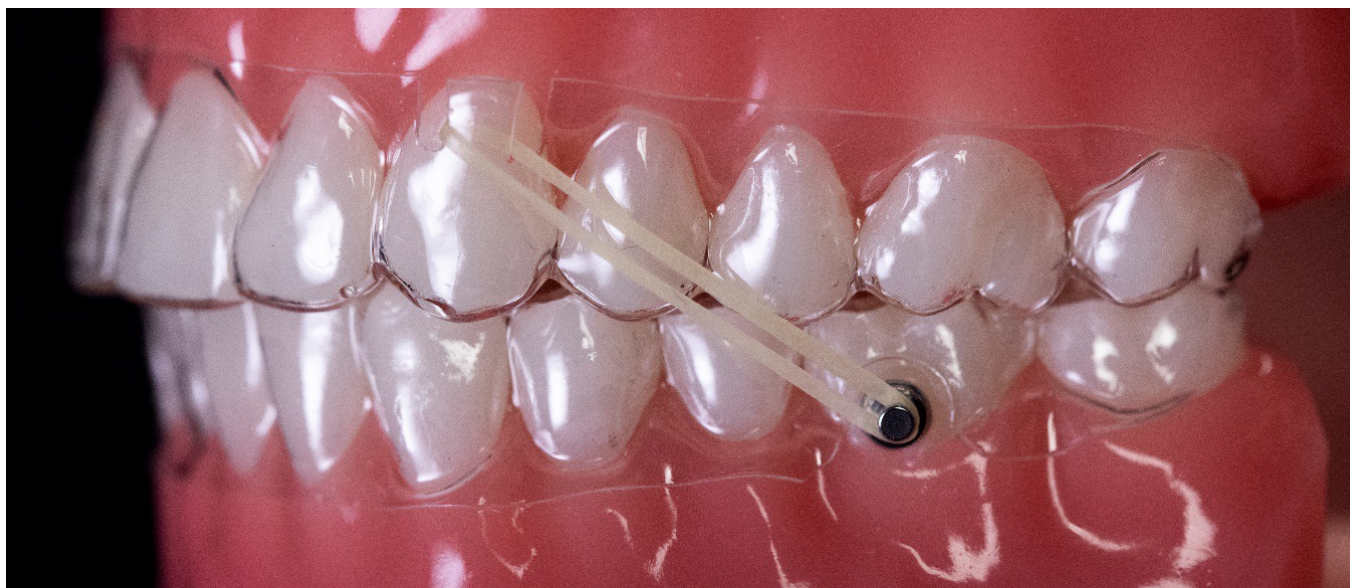
Schlitz- zu Button-Cutout