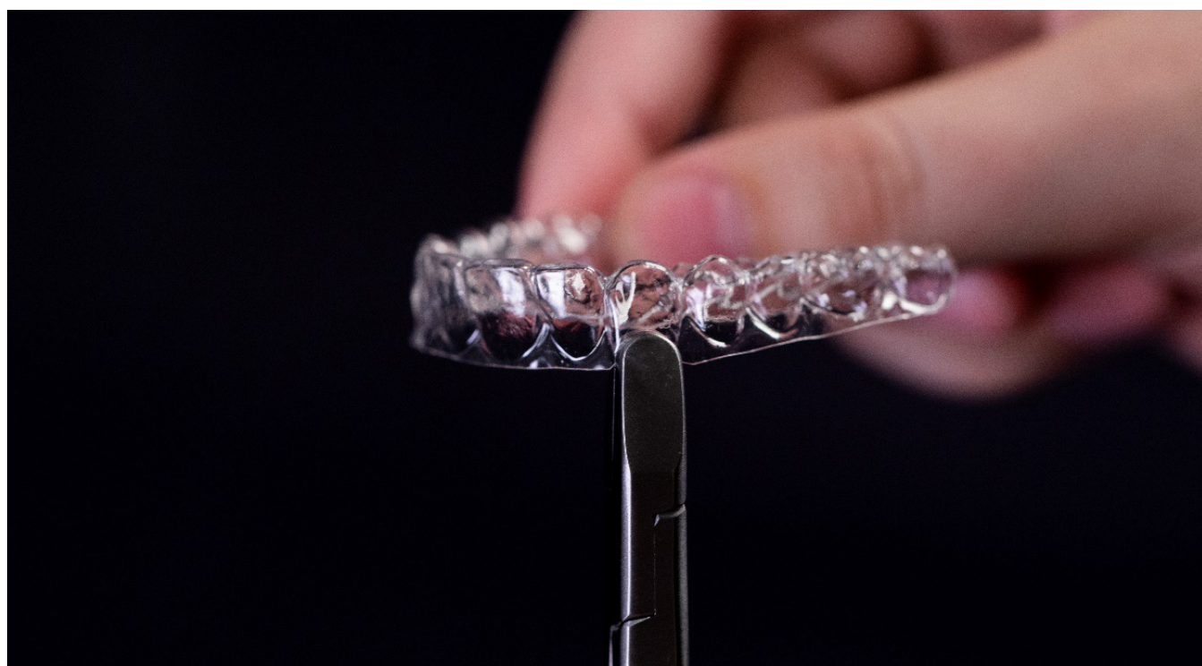
Découpe pour bouton au-dessus de la canine de l'arcade supérieure

1. Modification de la/des gouttière(s) pour préparer le collage des boutons : utilisez un emporte-pièce pour découpe circulaire, ou une fraise acrylique ou diamantée, pour découper et enlever une zone semi-circulaire de la marge gingivale des gouttières située au-dessus de la canine supérieure et sous la première molaire inférieure, à l'endroit prévu pour le collage des boutons.