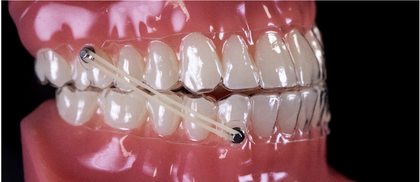
Découpe pour une configuration bouton à bouton