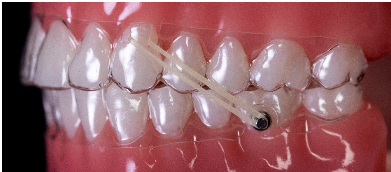
Découpe pour une configuration fente à bouton