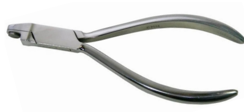
Emporte-pièce pour découpe circulaire