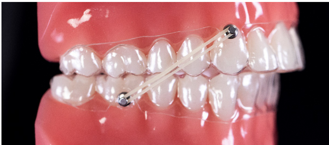
Découpe pour une configuration bouton à bouton