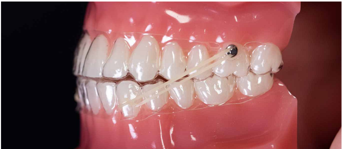
Découpe pour une configuration fente à bouton