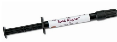
Resina ortodontica per l'incollaggio