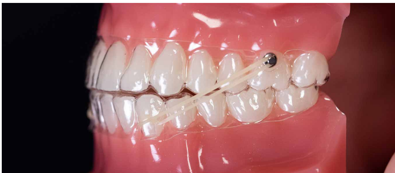
Intagli da fessura a bottone