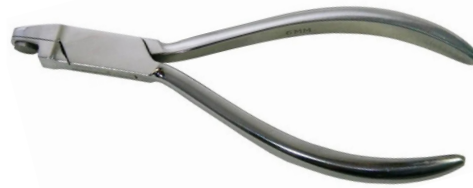
Pinza punzonatrice per i fori nell'allineatore