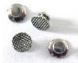
Bottone in metallo per i denti posteriori