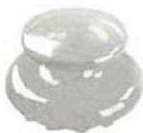
Bottone in ceramica/ plastica per i denti anteriori per preservare l'estetica