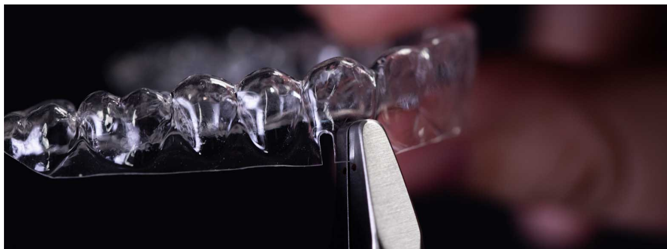
Doppio intaglio sopra al canino dell'arcata superiore

1. Modificare l'allineatore superiore (o gli allineatori) per l'uso di elastici negli intagli a fessura dell'allineatore: Usare una pinza per fessure degli allineatori per creare un doppio intaglio sul margine gengivale sopra ai canini superiori, dove si attaccherà l'elastico.