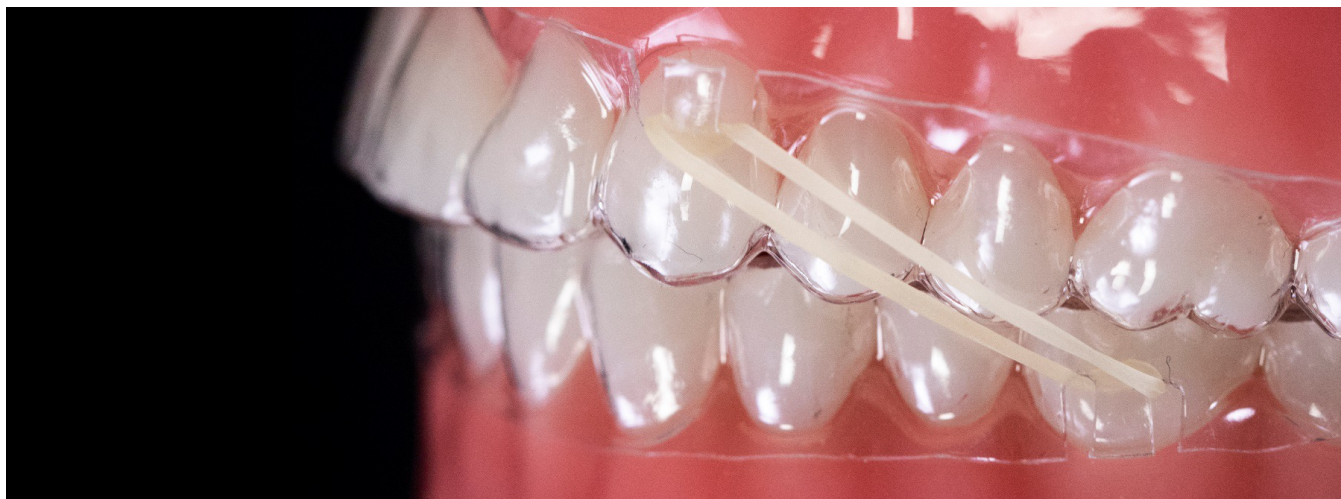
Intaglio da fessura a fessura

3. Posizionamento dell'elastico: Inserire l'allineatore e tirare l'elastico sul pezzo di margine gengivale tra le due fessure sopra ai canini. Poi tendere l'elastico e tirarlo sopra al margine gengivale tra le due fessure sotto ai molari inferiori.