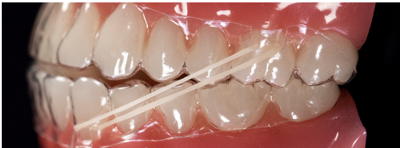
Intaglio da fessura a fessura

3. Posizionamento dell'elastico: Inserire l'allineatore e tirare l'elastico sul pezzo di margine gengivale tra le due fessure sopra ai molari. Poi tendere l'elastico e tirarlo sopra al margine gengivale tra le due fessure sotto ai canini inferiori.