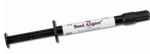
Resina ortodôntica composta para colagem