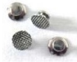
Botão de metal para dentes posteriores