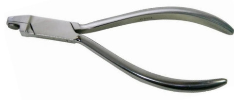
Alicate perfurador de alinha- dores