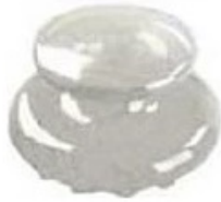
Botão em cerâmica/ plástico para dentes an- teriores para preservar a estética