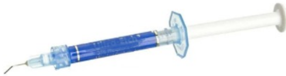
Ácido fosfórico a 35%