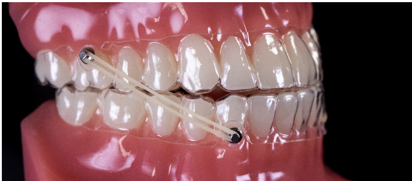
Recortes de botão para botão