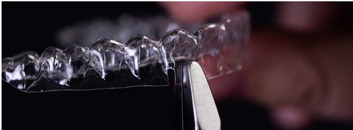
Doppelter Schlitz-Cutout über dem Oberkiefer-Eckzahn

1. Modifizieren Sie den Aligner für den Oberkiefer, um die Verwendung von Gummis mit Schlitz-Cutouts vorzubereiten: Erstellen Sie mit einer Aligner-Schlitzstanze einen doppelten Schlitz am Gingivarand über den Oberkiefer-Eckzähnen, d. h. dort, wo das Gummi befestigt wird.