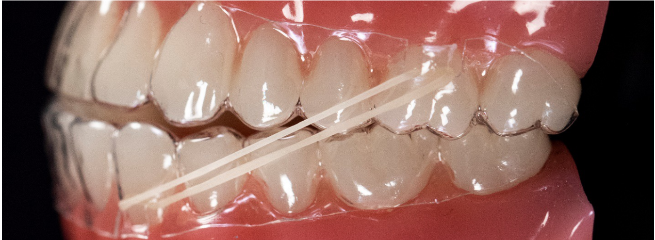
Schlitz- zu Schlitz-Cutout

3. Platzierung des Gummis: Setzen Sie den Aligner ein und ziehen Sie das Gummi über das Stück Gingivarand zwischen den beiden Schlitzten oberhalb der Molaren. Ziehen Sie dann das Gummi über den Gingivarand zwischen den beiden Schlitzten unterhalb der Unterkiefer-Eckzähne.