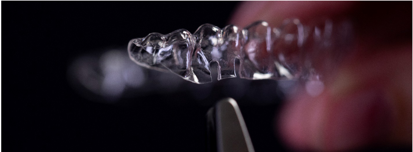
Doppelter Schlitz-Cutout unter dem ersten Unterkiefer-Molaren

2. Modifizieren Sie den Aligner für den Unterkiefer, um die Verwendung von Gummis mit Schlitz-Cutouts vorzubereiten: Erstellen Sie mit einer Aligner-Schlitzstanze einen doppelten Schlitz am Gingivarand unter den Molaren.