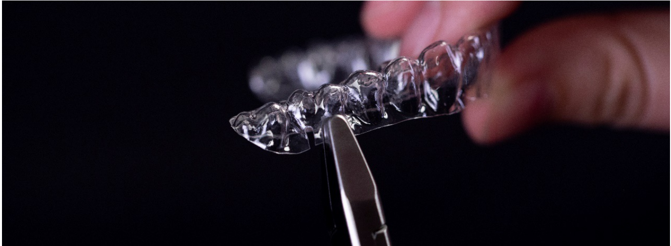
Doppelter Schlitz Cut Out über dem ersten Oberkiefer-Molaren

1. Modifizieren Sie den Aligner für den Oberkiefer, um die Verwendung von Gummis mit Schlitz-Cutouts vorzubereiten: Erstellen Sie mit einer Aligner-Schlitzstanze einen doppelten Schlitz am Gingivarand über den Oberkiefer-Molaren, d. h. dort, wo das Gummi befestigt wird.